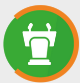
Beurs, Congres, Vergader- en Evenementenlocaties