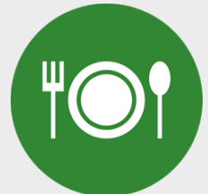
Eten & Drinken